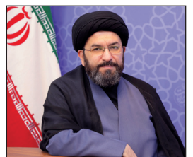
تشکیل کارگروه مشترک برای توسعه شوراهای فرهنگی قرآنی